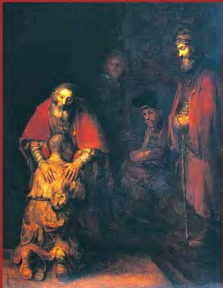
Henri J.M. Nouwen

鲁云：“一开始我就知道不仅 是小儿子，还有大儿子也会显 出这趟旅程的重要性。而父亲 很久以来一直是『外人』，接 受我，赦免我，给我住处，赐 我平安与喜乐。父亲就是我回 转的地方，旅程的目的地，也 是我最终的憩息处。我只有渐 渐，同时经历不少痛苦，才体 认到：若天父一直是个局外 人，我的属灵旅程就永不会完 整。”