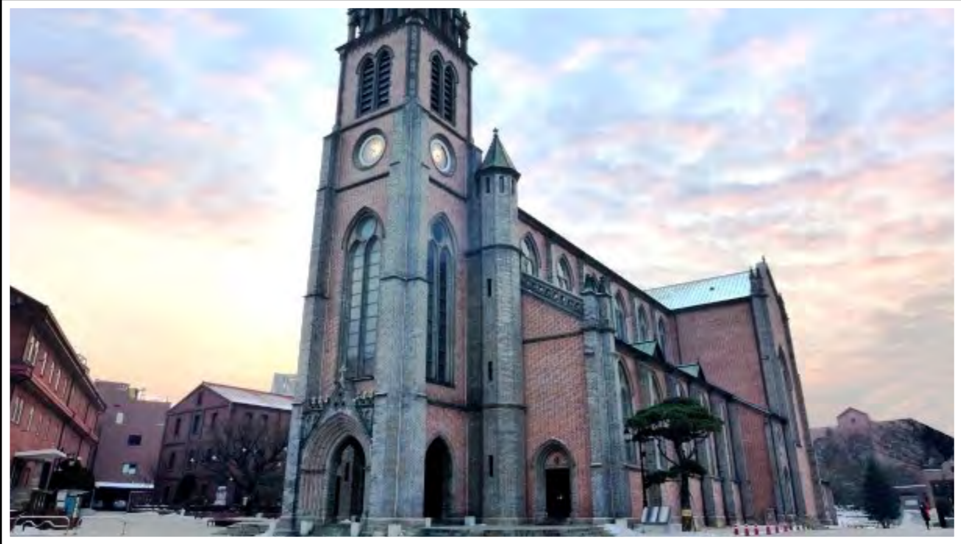
首尔光盐教会(马铃薯汤教会)