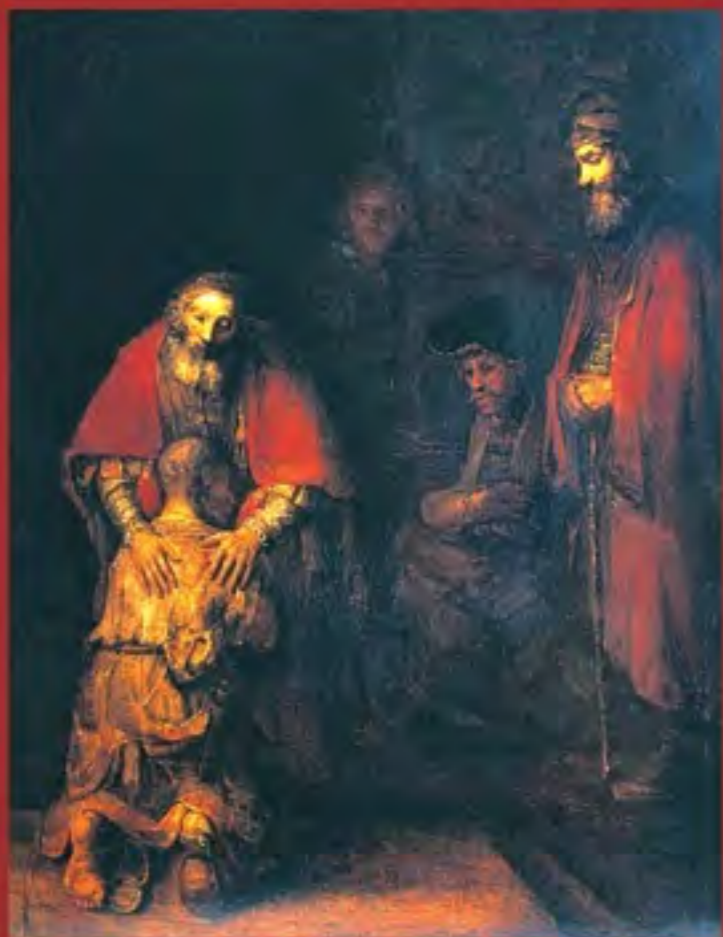
Henri J.M. Nouwen