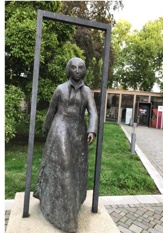
凱蒂 (Katharina Von Bora)