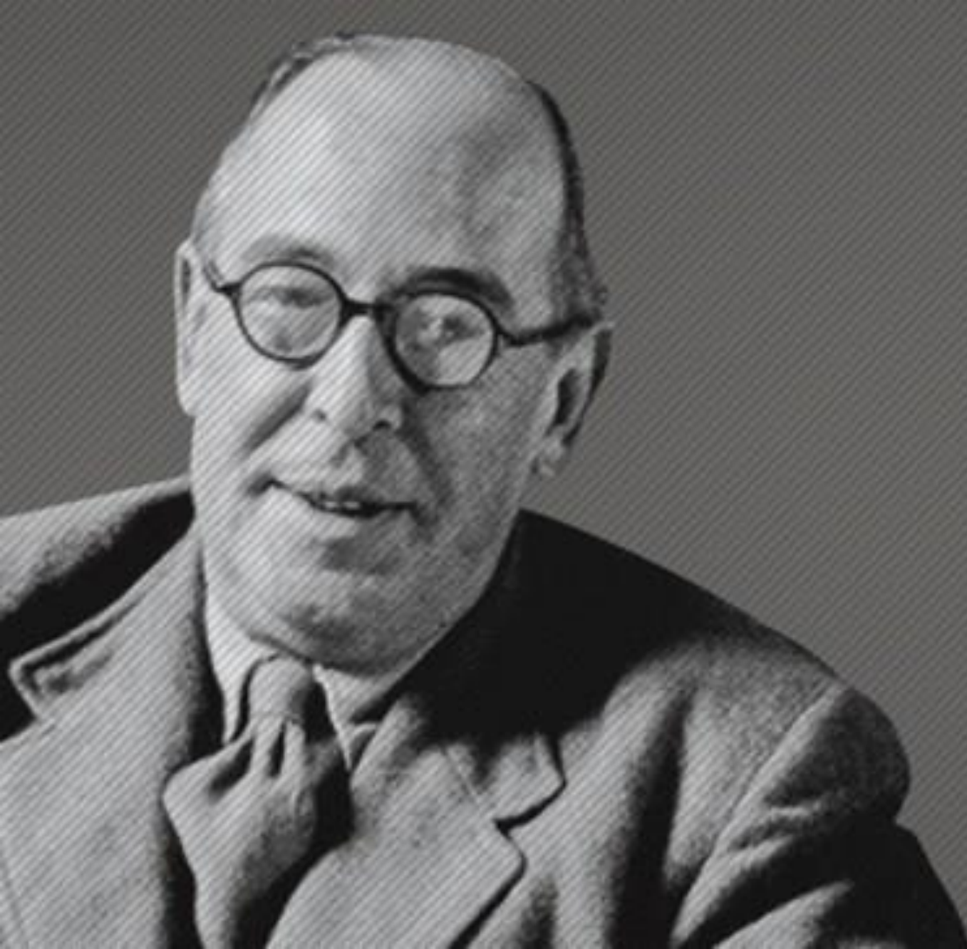
C.S. LEWIS 1898–1963