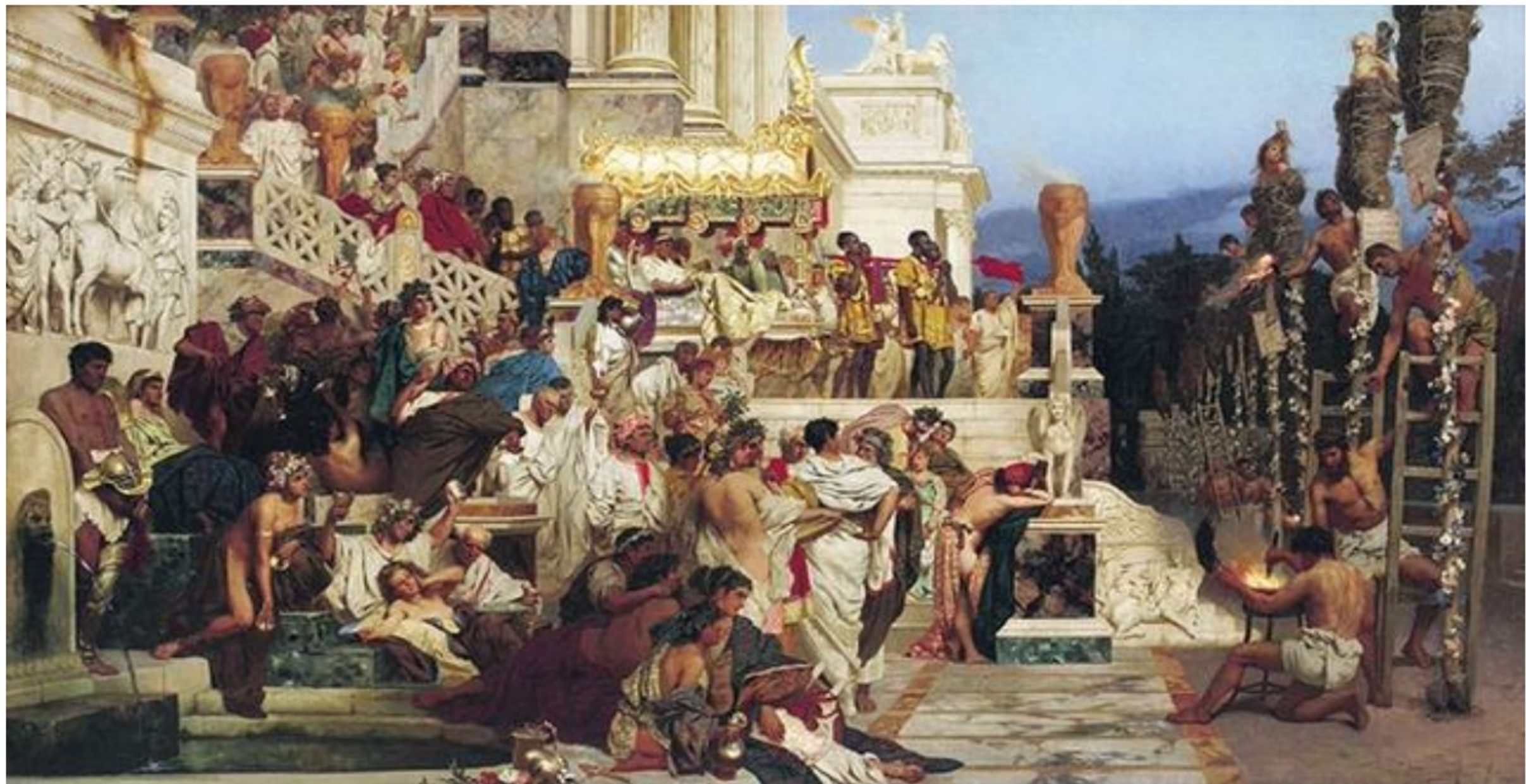
油畫《尼祿的火炬》描述羅馬皇帝尼祿用火刑迫害基督徒